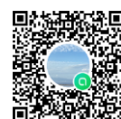
オープンチャット

また、出入り自由で登録できるオープンチャットも開設しました。主に事務局からの情報発信・伝達用に使用します。トークルームで「学会発表者」を選び、参加コードは「oha5526」を入力してすすみます。登録後は画面右上の三本線よりノートの内容をご確認ください。