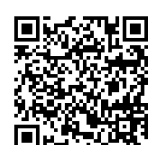
大容量ファイル転送サービスの利用方法