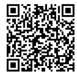
PPT画面サイズ 設定・変更方法