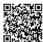
大容量ファイル転送サービスの利用方法

○PPTファイルのサイズは原則3MB以内とします。PPT等の画像圧縮機能をご利用ください。ま